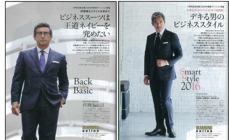
(2016年秋冬ファッション)

週刊ダイヤモンド : 2017年3月25 (3月21日発売)号 ダイヤモンド・オンライン: 2017年3月21日~4月21日